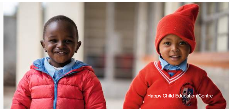
Happy Child Education Centre