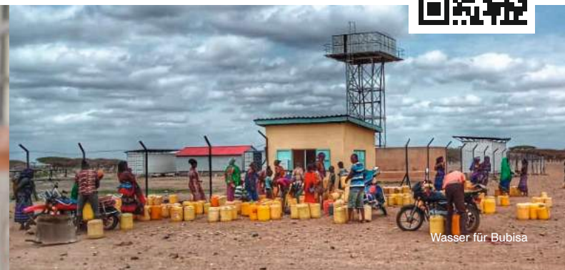
Wasser für Bubisa