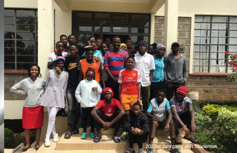
2023er Jahrgang JKR Studenten