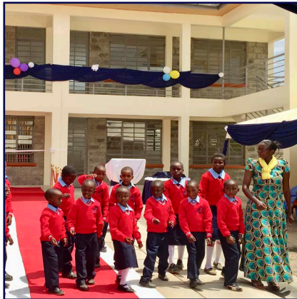
Einweihung Happy Child Education Center