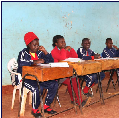
In Bildung investieren: Schüler des MMH