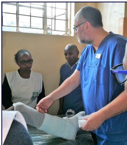
Training im Medical Centre